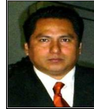
Jefe de la Oficina Operadora

CAEV COMISIÓN DE AGUA DEL ESTADO DE VERACRUZ